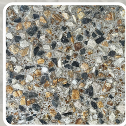
8353 - 80% NOIR 20 % GOASQ