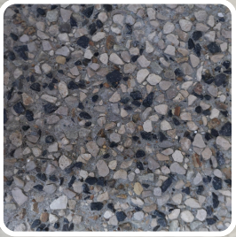
8347- 80% BEIGE 20% NOIR