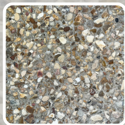
8361 - 50% SARTHOIS 50% BLANC