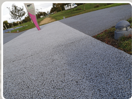
Béton drainant : Salle Dolia St Georges de Montaigu