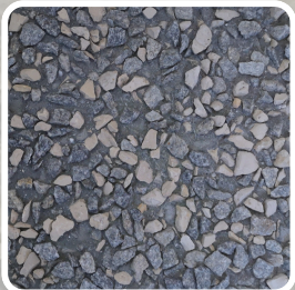
8352 - 30% BLANC 70% GRIS