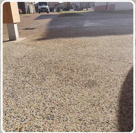
Béton Désactivé décarboné : Rue des jardins La Bernardière