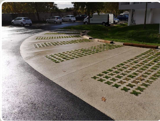
Béton Désactive décarboné : Parking de la Mairie St Georges de Montaigu