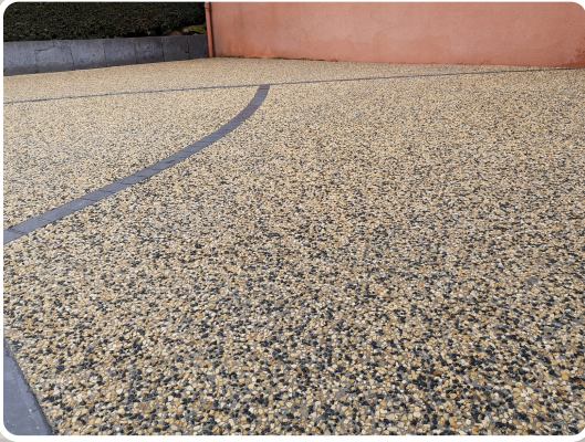
Entrée de maison chez un particulier