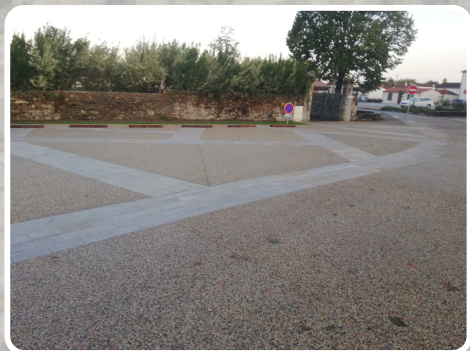
Béton désactivé : Place de la Mairie St Georges de Montaigu