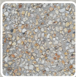
8339 - 100 % 8/12 PALVADEAU

Le béton désactivé est un béton qui laisse apparaître des graviers de couleurs à la surface. Très apprécié pour son esthétique, il convient parfaitement pour la réalisation d'une allée ou d'une terrasse.