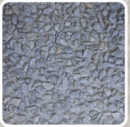
8334 - 100% GRIS VALLET